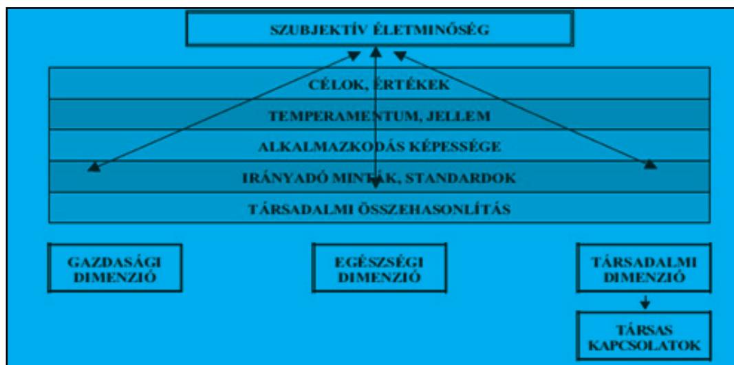
1. ábra. A szubjektív életminőség meghatározó dimenziói és a szubjektív szűrők.

megélt szintje a szubjektív életminőség mindenképpen komplex fogalom, és összetett a háttértényezők rendszere is, amely meghatározza. Mind egyéni, mind társadalmi komponensek szerepet játszanak ebben.